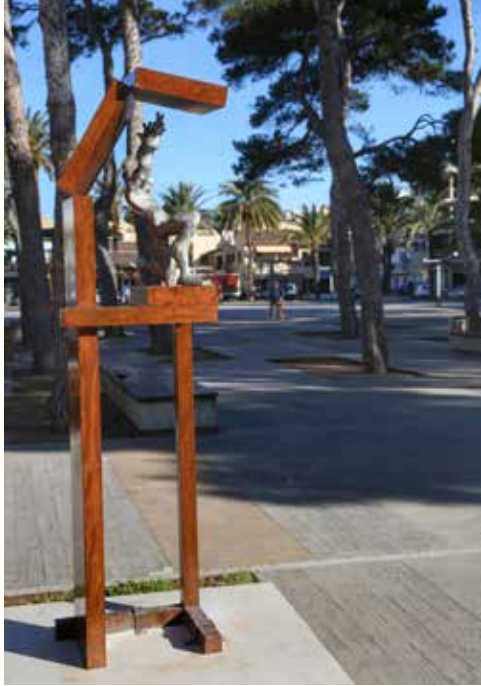
Plaça dels Pins