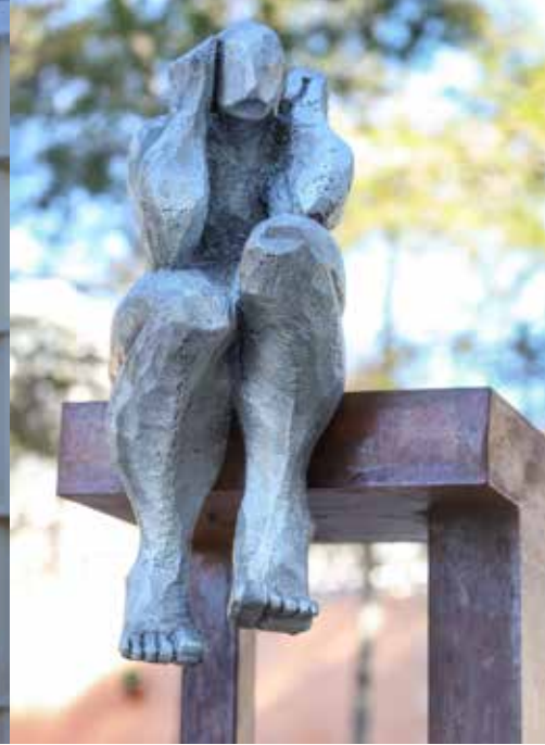
Centre Cap Vermell (Carrer de l'Agulla, 50)