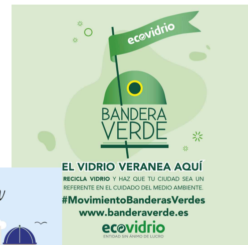
Imágenes para RRSS